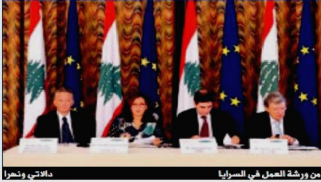
من ورشة العمل في السرايا دالاتي ونهرا